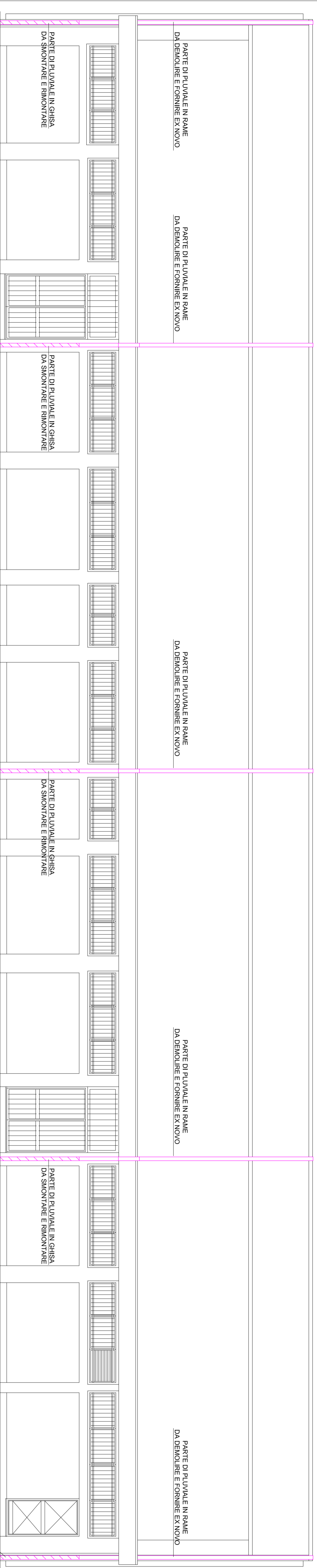
PROSPETTO SUD OVEST