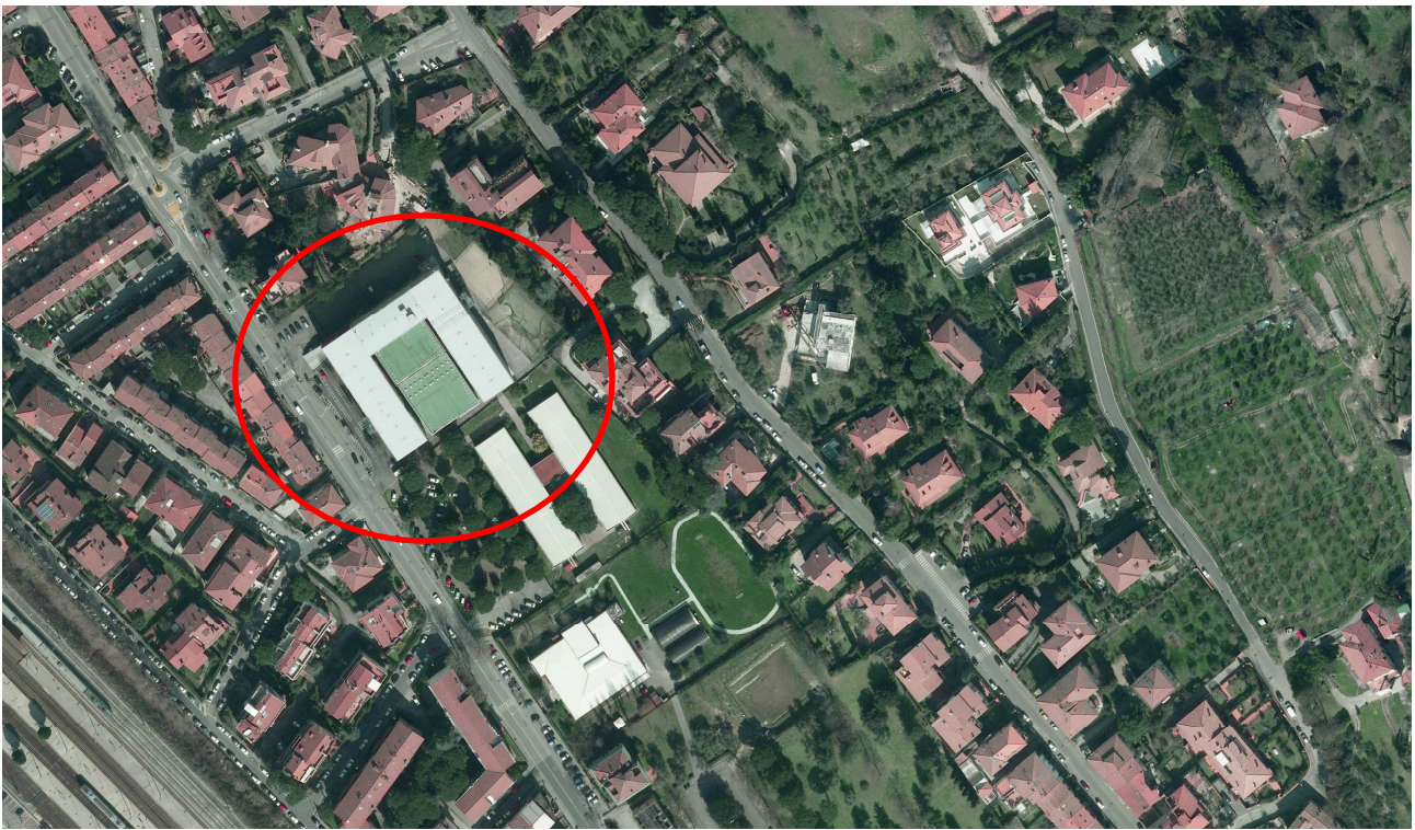
Ortofoto dell'area oggetto di intervento

Si riporta di seguito l'individuazione dell'area oggetto di intervento mediante foto aerea, estratto di mappa catastale e di P.R.G.C..