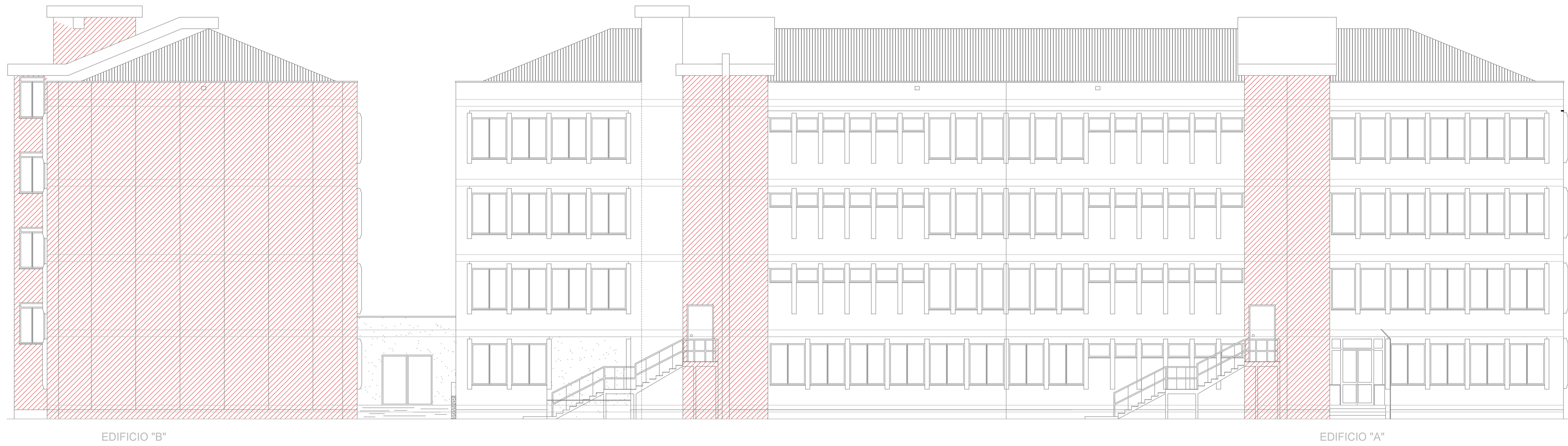
PROSPETTO NORD scala 1:100