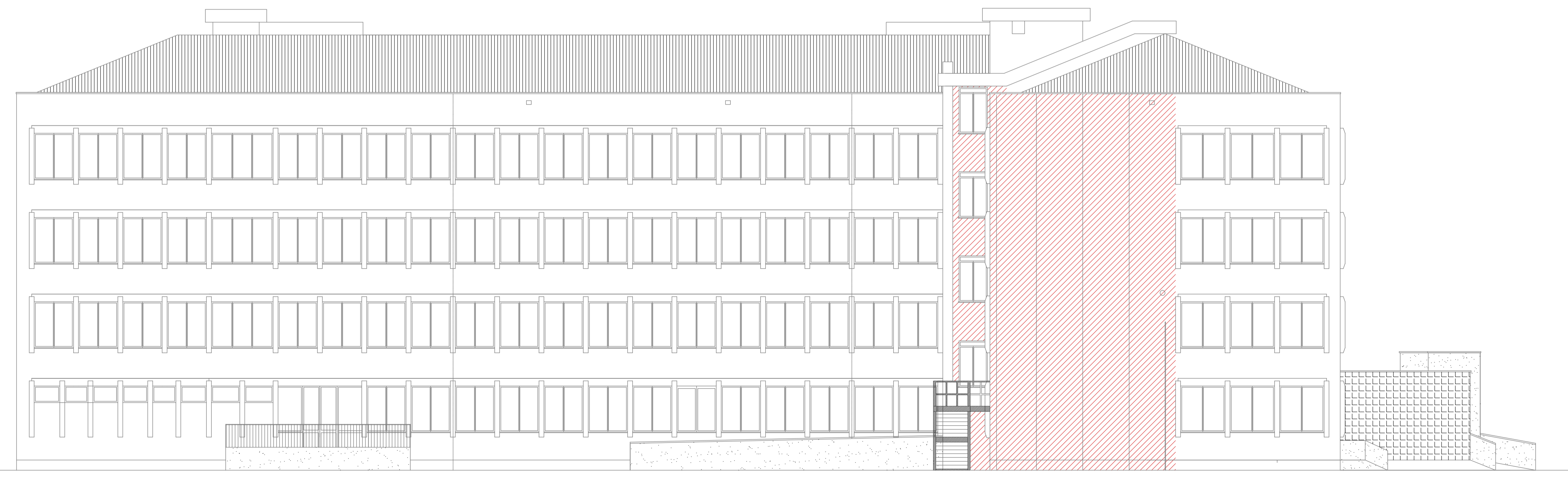
PROSPETTO OVEST scala 1:100