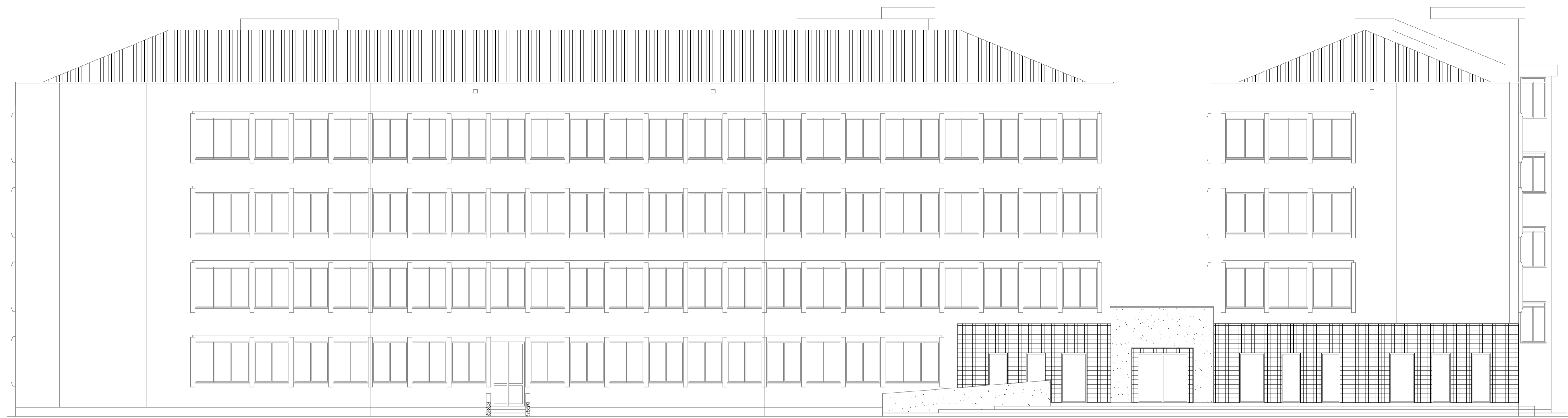
PROSPETTO SUD scala 1:100