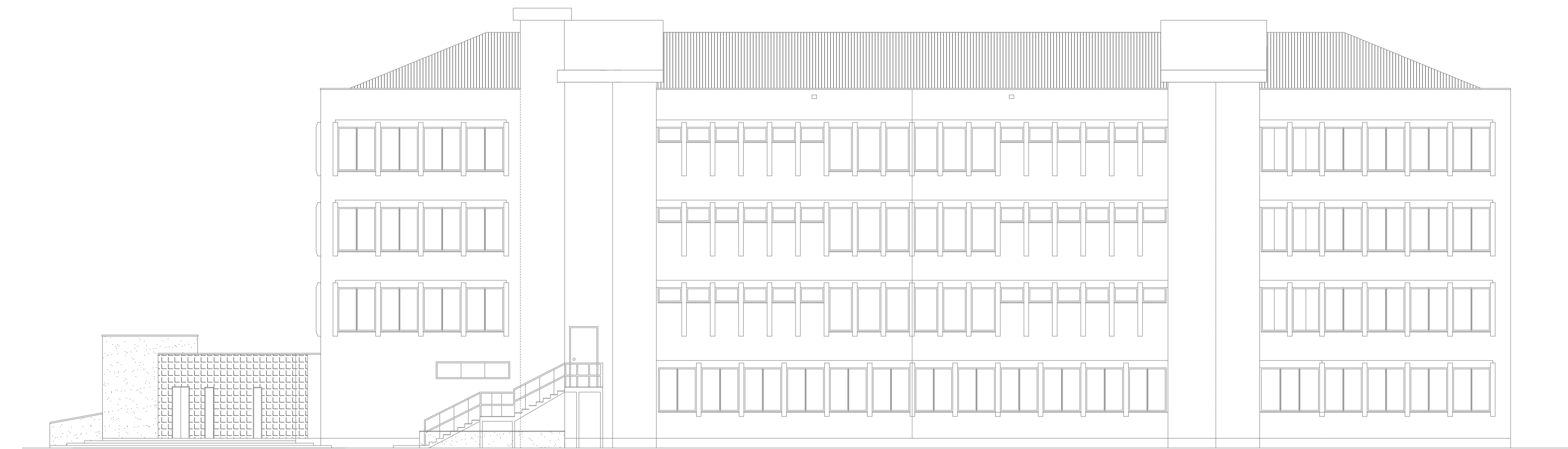
PROSPETTO EST scala 1:100