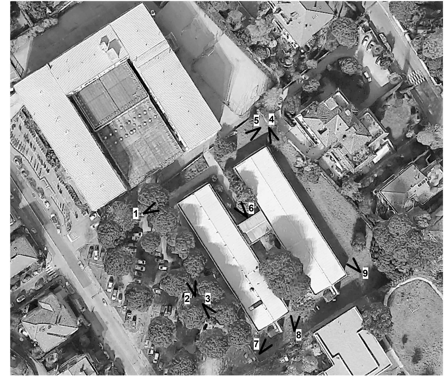
Keyplan della documentazione fotografica